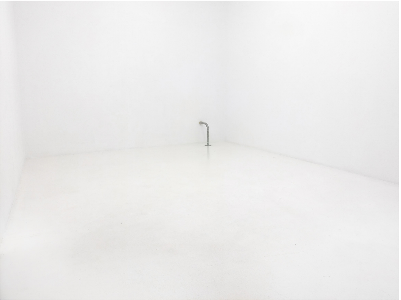
INCOMODIDAD ETÍLICA, 2015